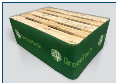
Pallehetter og pallesvøp